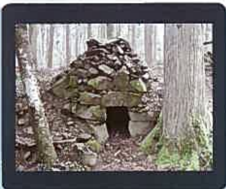
袈裟岩堂の石風呂