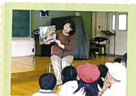
学校での読み聞かせの一場面

皆さんもこの喜びを味わってみませんか？ 「おいしいおかゆ」では毎日会員募集中です。興味をお持ちの方、是非ご連絡ください。大歓迎です。