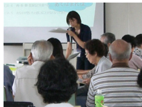
湯田地域交流センターで開催された「第 2 回西京老人だいがく」での食生活に関するミニレクチャーと、その後の懇談会。