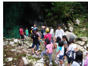
8 月に開催された小学校 4 年生以上を対象にした環境学習講座「エコココスクール」でのボランティア活動の様子。