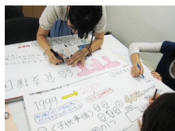
「YPU TFT PROJECT ～To もにFu れあいTsu ながろう～」

6月30日に、学内で全学生対象に現代世界の食糧事情とTFTとは何かについての勉強会を開催しました。