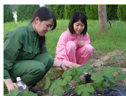
「La ferme de cerises～県大ばたけ～」

6月30日に、学内で全学生対象に現代世界の食糧事情とTFTとは何かについての勉強会を開催しました。