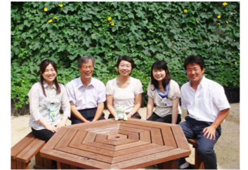
学生活動支援センター職員

学生スタッフ制度や課外インターンシップ制度などの学生の自主的な活動のサポート、みなさんの夢をかなえるプロジェクト「YPU ドリームアドベンチャープロジェクト」の実施などで、より豊かなキャンパスライフを応援しています。また、小学生のための夏休みの宿題勉強会や大学フェスタなどのイベントも実施し、学生と地域との関わりも大切にしています。