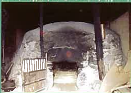
まんじゅう型石積み式石風呂