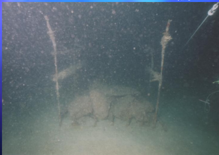
H15.11.17調査(観察した11基中4基が左の写真のように消失)