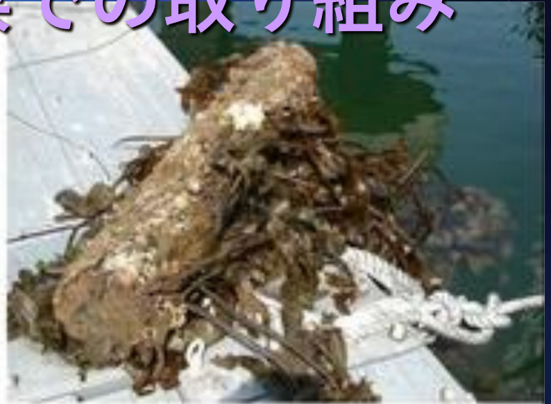
上:引き揚げたテストピースカジメが多く定着