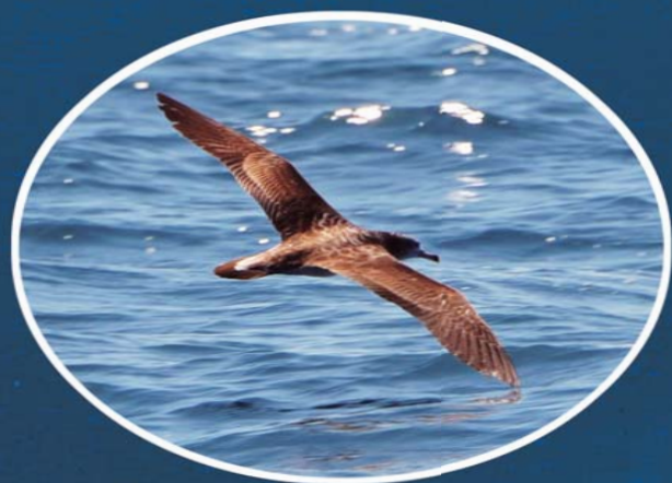
9. オオミズナギドリ