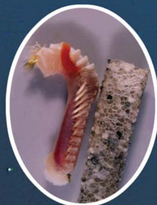
1. ヒウチウミイサゴムシ