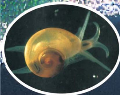
4. ヤシマイシン近似種